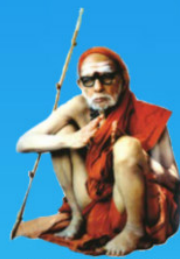
గురు చంద్రశేఖర పరమాచార్య