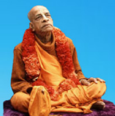
గురు భక్తవేదాంత ప్రభుపాద